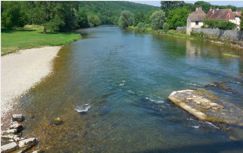
Port Lesney