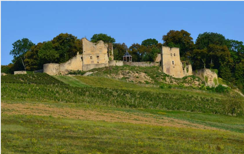
Chateau d'Arlay