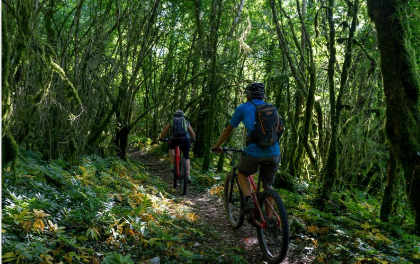
VTT en forêt de Chaux