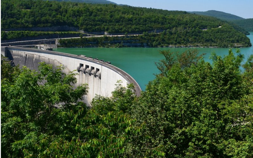
Le Barrage de Vouglans