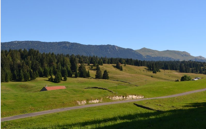
Les Molunes dans les Hautes-Combes