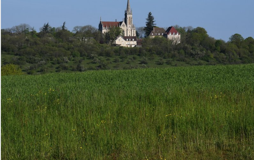
Mont Roland (Jouhe)