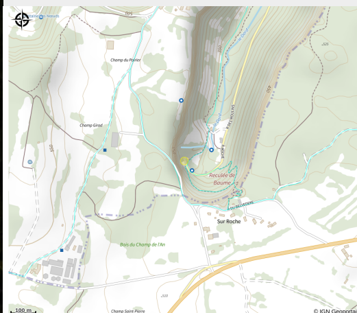
Crédit photo : GROTTES DE BAUME-LES-MESSIEURS_1 (Grottes Baume-les-Messieurs)